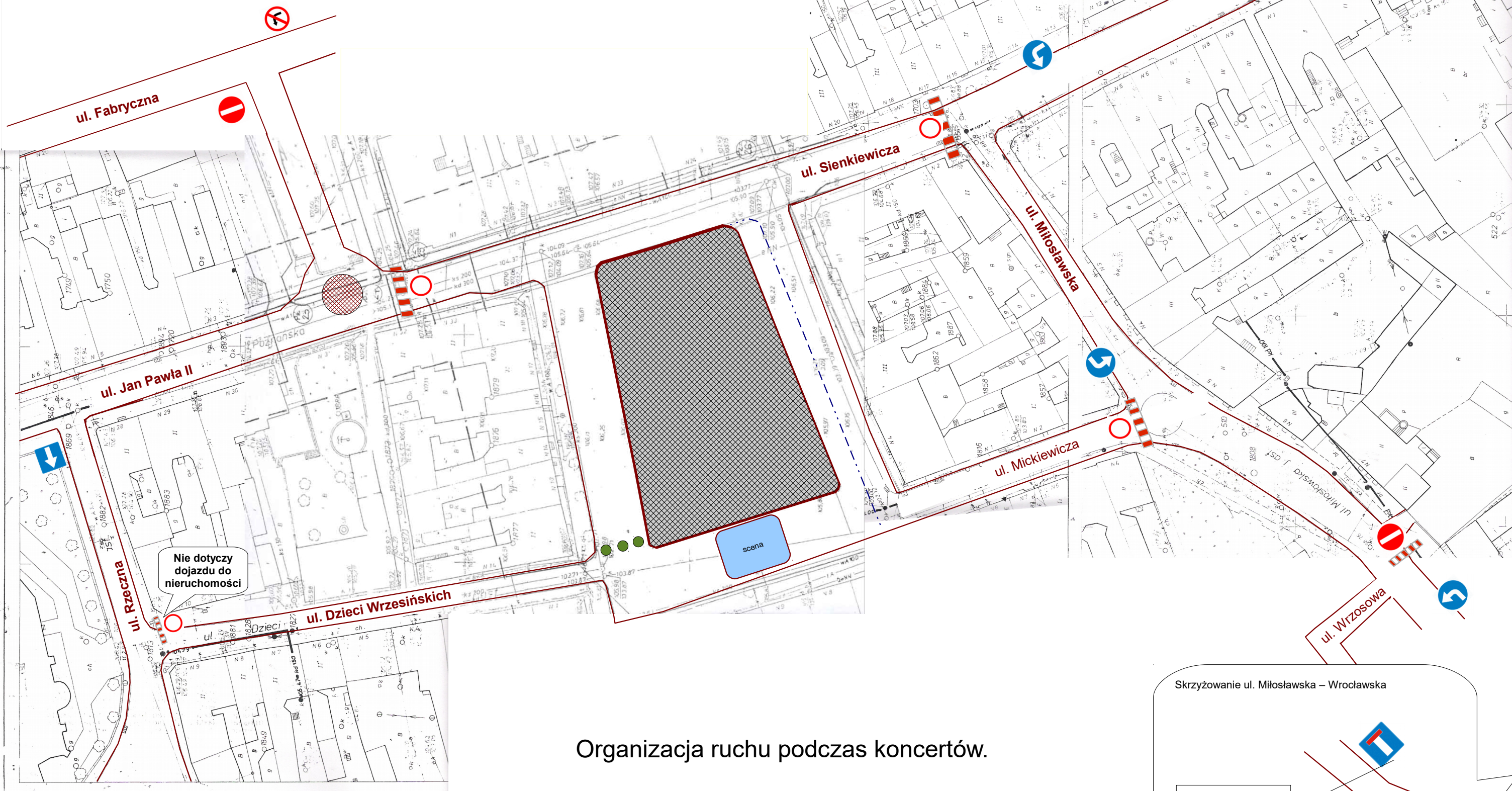
Organizacja ruchu podczas koncertów.